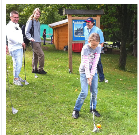
Swingolfen im Kurpark Braunlage, 2010

Kennzeichnend für den Swingolf ist eine besondere pädagogische, Gruppen verbindende Komponente: Viele Bevölkerungsgruppen sollen an die besondere Faszination dieser Ballsportart heranführt werden. Ausdruck dessen war u.a. die Ausrichtung der Internationalen Sportwoche der Deutschen Seemannsmission in Hamburg [5] oder die 18-Loch-Anlage einer karitativen Stiftung in Lavigny am Genfer See - Austragungsort der Europameisterschaften 2010 - die von Menschen mit und ohne Behinderungen betrieben wird [6] .