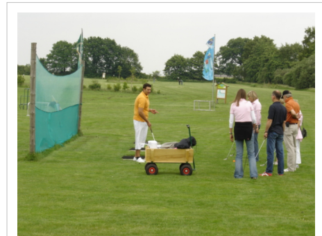
Erste Übungsschläge am Netz