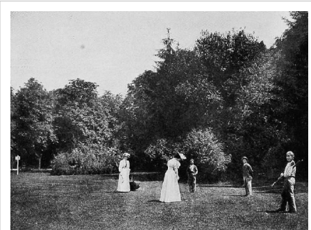
Golfen im Kurpark Bad Homburg, 1903