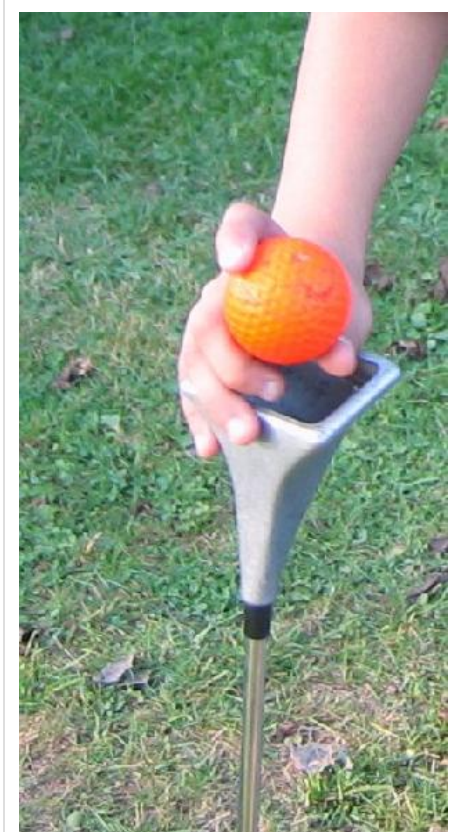
Swingolf-Ball und -Schläger